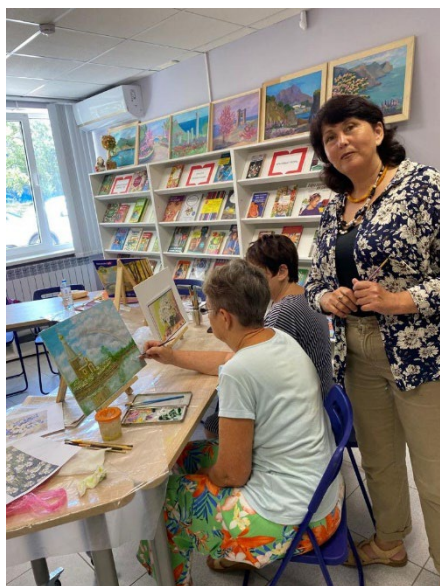
Фото с мероприятия:

10 мастер-классов за квартал. Количество участников: в зависимости от мероприятия от 5 до 20 человек.