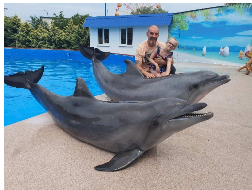
Фото с мероприятия:

Акция «Заветное желание». Специалисты семейной приемной ВОРДИ провели поздравления именинников детей с инвалидностью РО ВОРДИ. Родители детей с инвалидностью заполнили анкеты с желаниями детей, а специалисты Семейной приемной ВОРДИ, спонсоры и волонтеры как настоящие волшебники стараются все воплотить в жизнь. Количество участников - 4