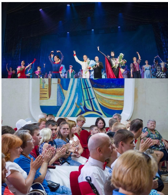
Фото с мероприятия: